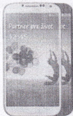
Samsung GALAXY S4

vyberte si špičkový Samsung s originálnym krytom za polovicu