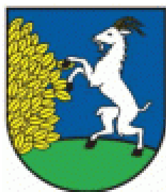
Obrázok 2 Erb Obce Príslop

Erb obce - v modrom štíte v zelenej oblej pažiti strieborná čiernokopytá koza z pravého okraja štítu vyrastajúci hľuk zlatých listov