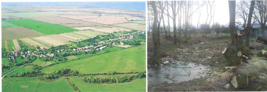
Bunkovce ležia v oblasti, ktorá je jednou z poľnohospodársky najproduktívnejších na Slovensku. Voda je tu veľmi dôležitá. Vľavo záber na obec, vpravo dnešný stav miesta, ktoré chcú vyčistiť pre budovanie rybníka.

Viac informácií: www.bunkovce.sk a www.medziriekami.sk